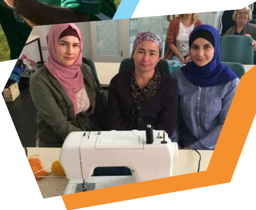
LÄNDLICHE ERWACHSENENBILDUNG BRANDENBURG (LEB)

Ich gehe gerne ins Fitness Studio und singe gerne. Am Brandenburgtag habe ich ein Lied geschrieben und es mit Freunden vorgetragen.