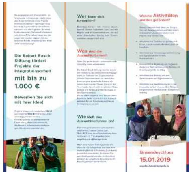
Flyer für die Ausschreibung der Förderprojekte

Der Auswertungsprozess durch das Auswahlgremium läuft aktuell, daher können wir hier leider noch keine Ergebnisse bekannt geben. Die Förderprojekte werden aber in ihrer weiteren Umsetzung betreut und Ergebnisse in den Prozess eingespeist.